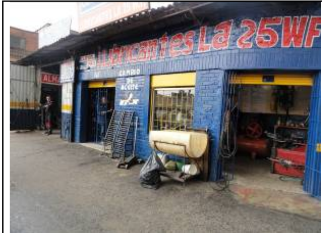
Foto No. 1 – Fachada del inmueble donde funciona el establecimiento de comercio.