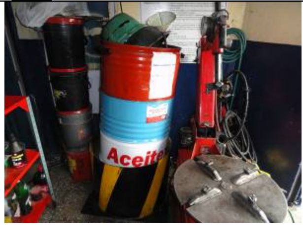
Foto No. 2 – Área temporal y recipientes de recibo primario, embudos y otros utensilios.