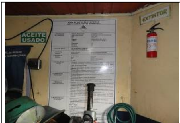
Foto No. 3 – Hoja de datos de seguridad para derrames de aceite usado